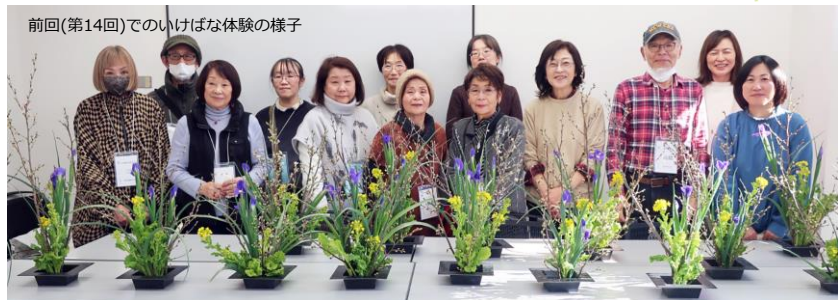
前回(第14回)でのいけばな体験の様子