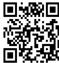
宛先アドレスのQRコード

お申し込み内容確認のため、返信させていただくことがあります。迷惑メールフィルターご利用の場合、当アドレスが受信できるよう設定をお願いいたします。