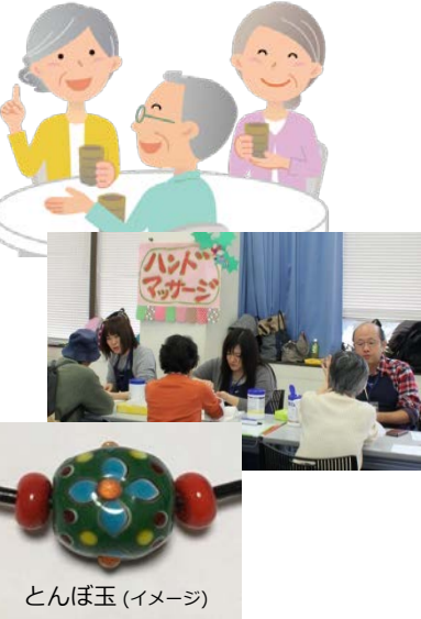
とんぼ玉 (イメージ)