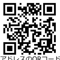
宛先アドレスのQRコード

お申し込み内容確認のため、返信させていただくことがあります。迷惑メールフィルターご利用の場合、当アドレスが受信できるよう設定をお願いいたします。