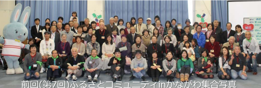
前回(第7回)ふるさとコミュニティinかながわ集合写真