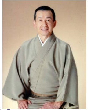
うた 民謡はふるさとの応援歌 福島県浪江町出身