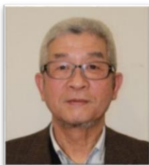
かながわ東北・ふるさとつなぐ会

それぞれの想いや考えがありますが、私達は昨年地域を超えた避難当事者中心の『つなぐ会』を発足させました。現在47世帯・75名の会員でバスハイク、寄り合い等の交流会を通じ情報交換しています。今年度も『あゆむ会』との連携で親しく楽しめる企画を予定しています。立場の同じお知り合いの方大歓迎です。よろしくお願いたします。