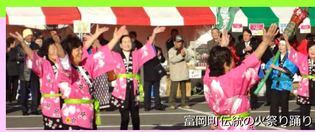
富岡町伝統の火祭り踊り (富岡町老人クラブ 踊りの会)