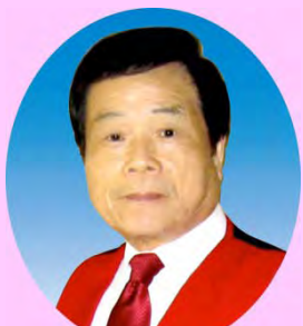
百笑溢喜 ひやくしょういっき

※入場の対象は東日本大震災の避難者の方となります。 詳しくは裏面の案内をご確認ください