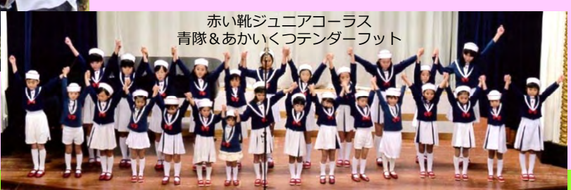
赤い靴ジュニアコーラス 青隊&あかいくつ団ダーフット