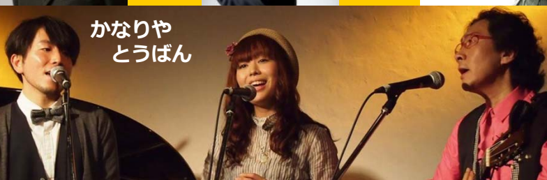
かなりや とうばん