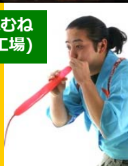
つねむね (笑顔工場)