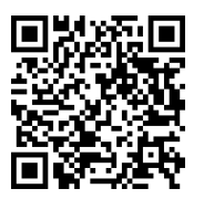
宛先アドレスのQRコード

お申し込み内容確認のため、返信させていただくことがあります。迷惑メールフィルターご利用の場合、当アドレスが受信できるよう設定をお願いいたします。